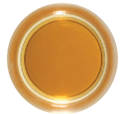
Mit Bellima®: kein Film, keine Trübung, kein Nachbittern, bestmögliches Aroma

2) Optimierung von kaltem Trinkwasser: Papierfächer in max. 1 Liter Trinkwasser hängen und kurz umrühren. Mindestens 30 Minuten einwirken lassen, dabei nach Möglichkeit mehrmals umrühren.